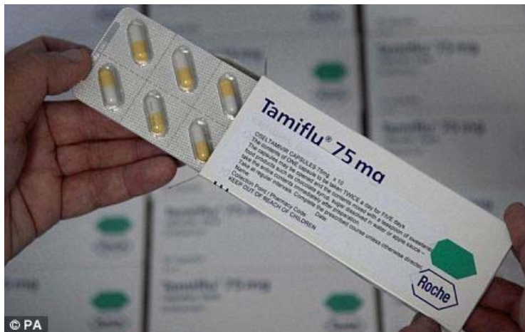
Ilustración 2: ¿Pánico terminado? El número de casos de influenza porcina ha caído bruscamente en semanas pasadas.

"Pero sería trágico si nosotros repetimos el ejemplo de Estados Unidos y terminamos con mas fatalidades por las vacunas. Yo le aplaudo al gobierno por reconocer el riesgo pero en la mayoría de los casos esto es un virus pequeño o calmado el cual necesita unos cuantos días de cama. Yo cuestionaría por que nosotros necesitamos una vacuna del todo."