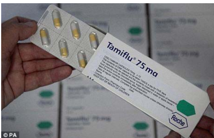
Ilustración 2: ¿Pánico terminado? El número de casos de influenza porcina ha caído bruscamente en semanas pasadas.

"Pero sería trágico si nosotros repetimos el ejemplo de Estados Unidos y terminamos con mas fatalidades por las vacunas. Yo le aplaudo al gobierno por reconocer el riesgo pero en la mayoría de los casos esto es un virus pequeño o calmado el cual necesita unos cuantos días de cama. Yo cuestionaría por que nosotros necesitamos una vacuna del todo."